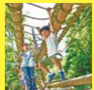
六甲山フィールドアスレチック