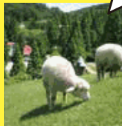
神戸市立六甲山牧場