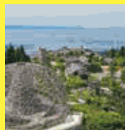
自然体感展望台 六甲枝垂れ 六甲ガーデンテラス