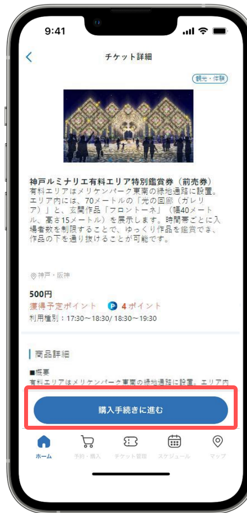
② 「購入手続きに進む」をタップ