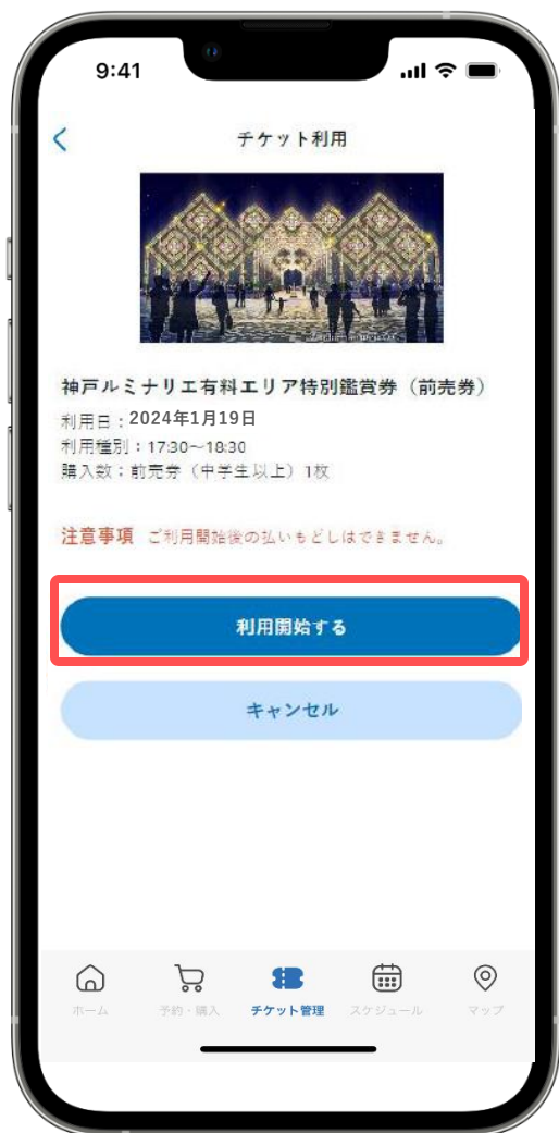
④ [利用開始する] をタップ