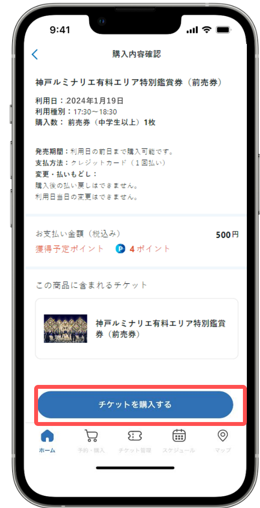
⑥ [チケットを購入する] をタップ