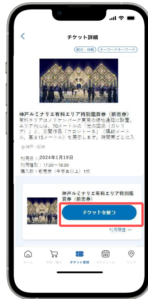
③ [チケットを使う] をタップ