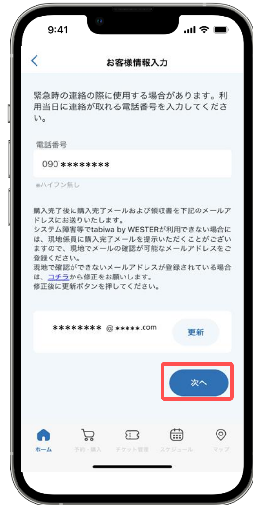
⑦お客様情報を入力し [次へ] をタップ