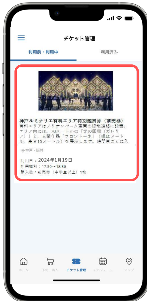
② 購入済みチケットをタップして詳細をみる