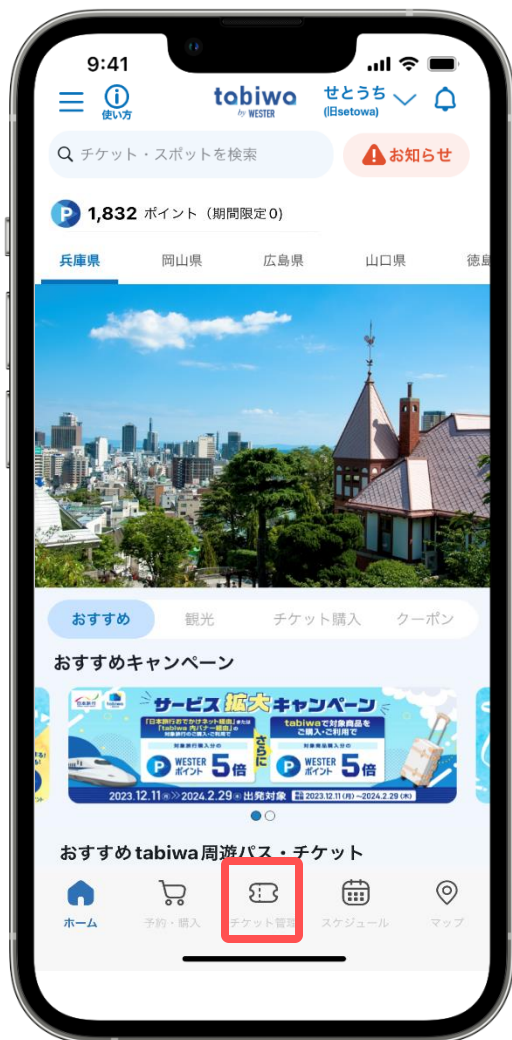
① [チケット管理] をタップ