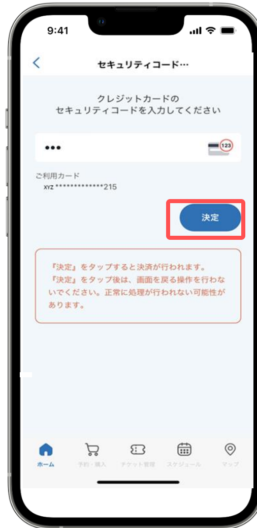
⑧セキュリティコードを入力し [決定] をタップ