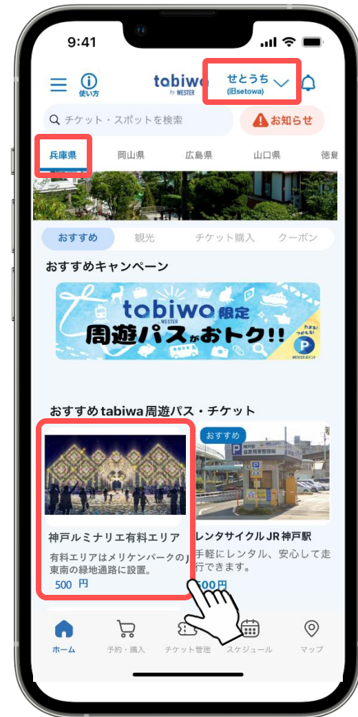
① tabiwoのせとうち 兵庫県の おすすめtabiwo周遊パス・チケットより 「神戸ルミナリエ有料エリア特別鑑賞券 (前売り券)」をタップ