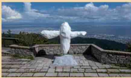
真田屋敷(Case) 六甲ミニツアート芸術散歩2023 beyond 六甲ガーデンテラスエリヤ