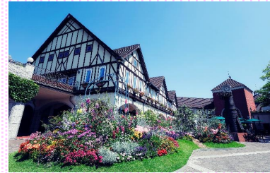
神戸布引ハーブ園