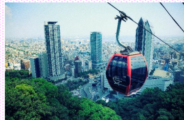
神戸布引ロープウェイ