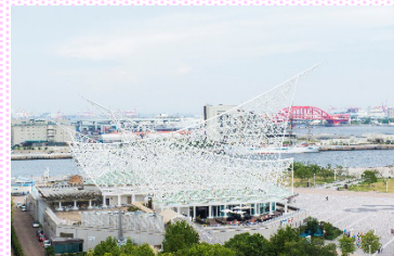
神戸海洋博物館