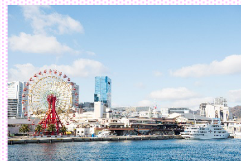
ハーバーランド