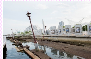
神戸港震災メモリアルパーク