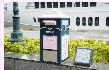
愛の郵便ポスト