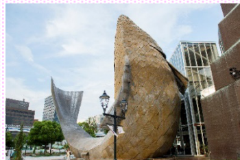
フィッシュダンス